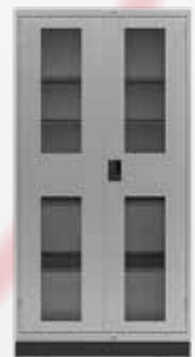
両開きキャビネット (窓付き)