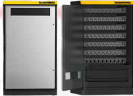
426型スパイラル機構キャビネット